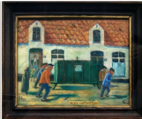
Algemene bedeldag te Aalst op de eerste woensdag n van iedere maand