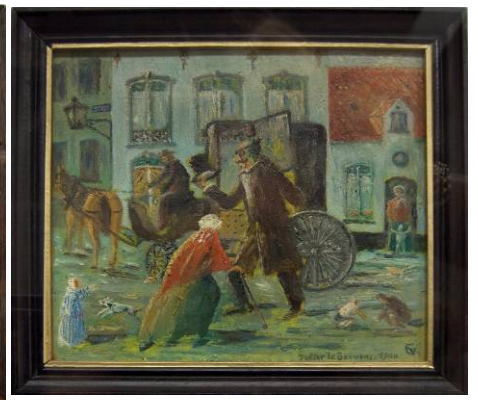
Op weg naar 't Gasthuys